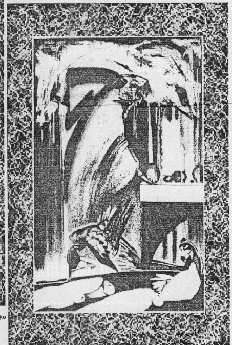
«Кропотливая работа с дождем»