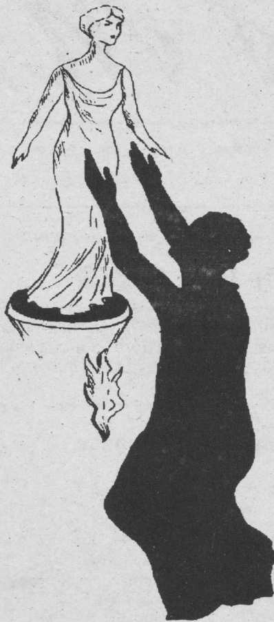
Пигмалеон и Галатя.

Я вижу - тусклое небо, Земля, как в седилах, в снегу. Никогда так холодно не было На этом, живом берегу.